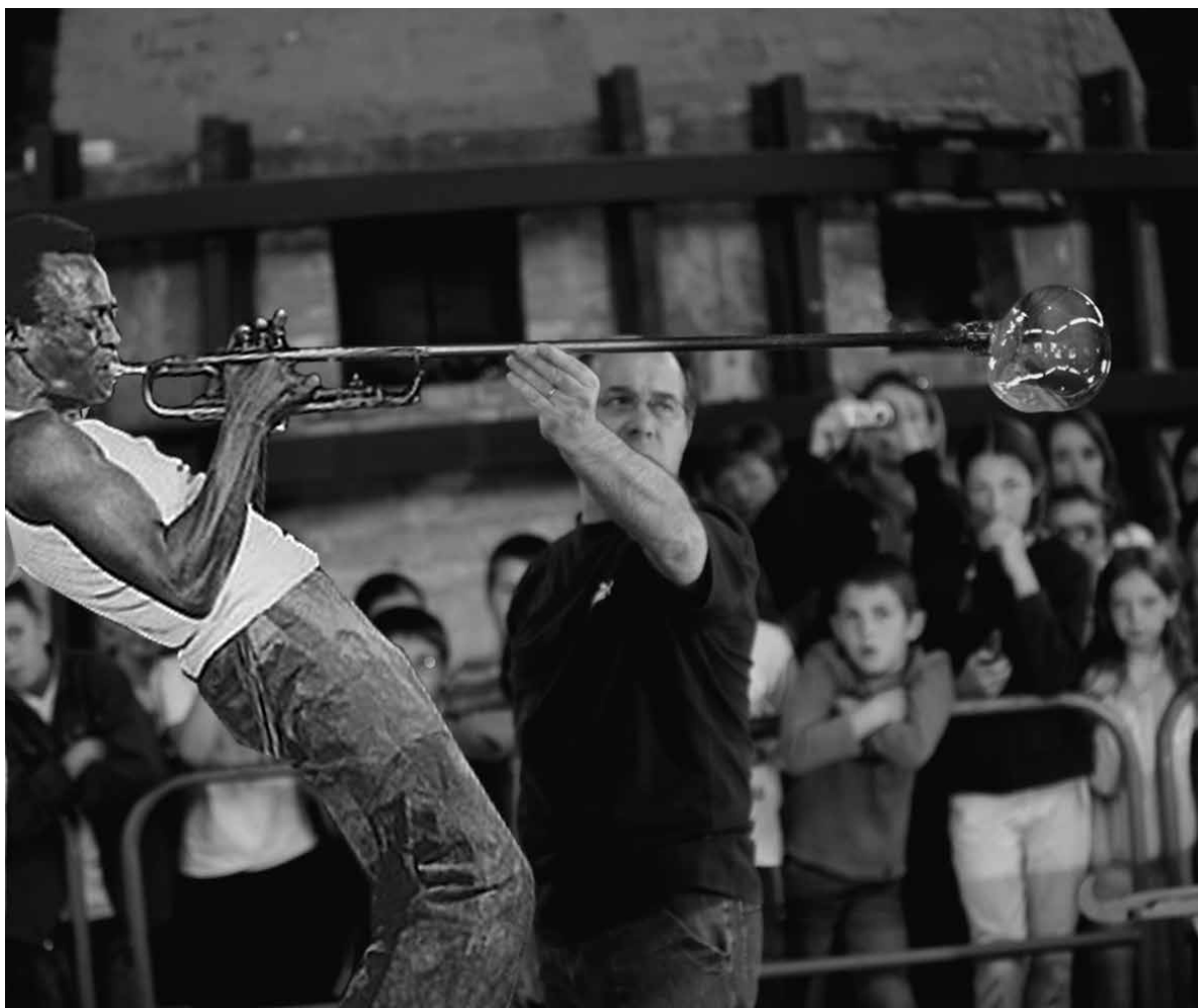
Anima con sordino / Simulation / 2015 /

* Musicien autodidacte (trompettiste) j'ai joué pendant plusieurs années dans diverses formations de Jazz (trio, Quintette, big band).