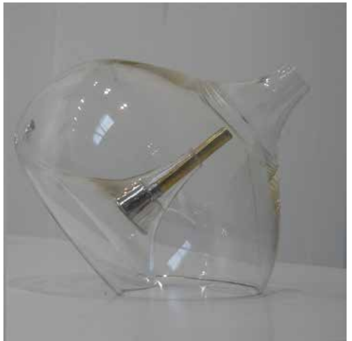
Big WahWah#002 / 2016