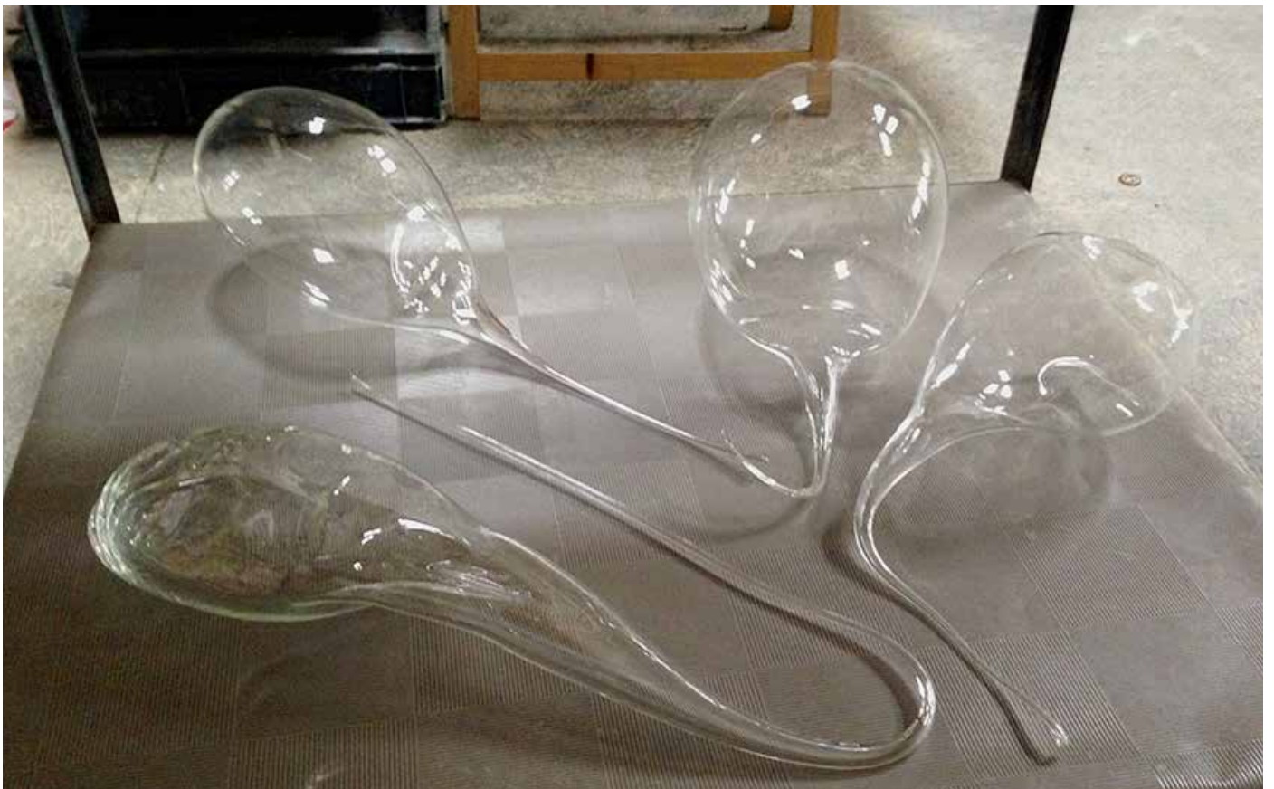
Ad lib 1,2,3,4 / 2016 Formes résultant d'Interprétations musicales jouées avec une trompette reliée à une canne de souffleur