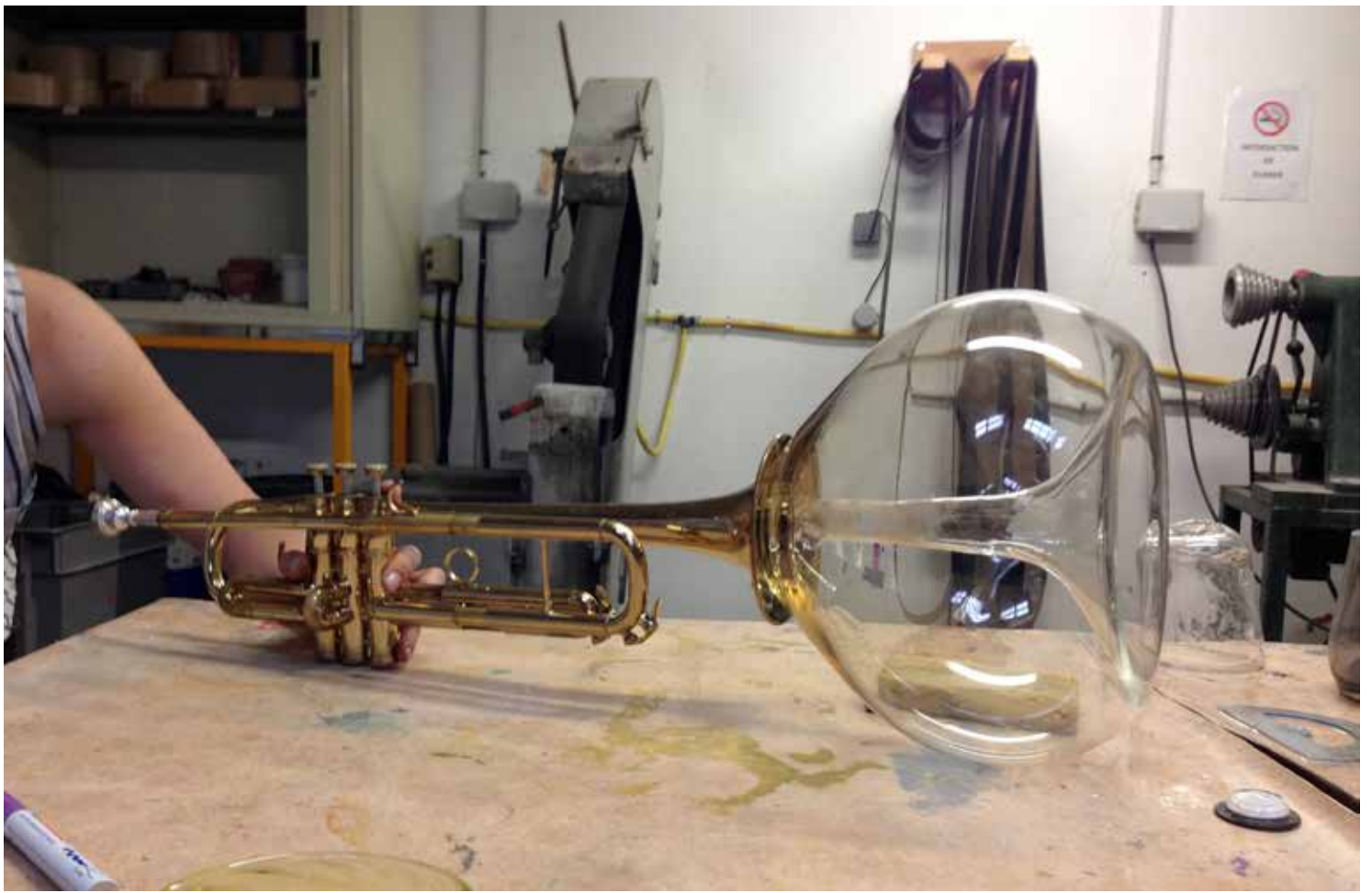
Big WahWah#001 / Images d'atelier Arcamglass / 2016