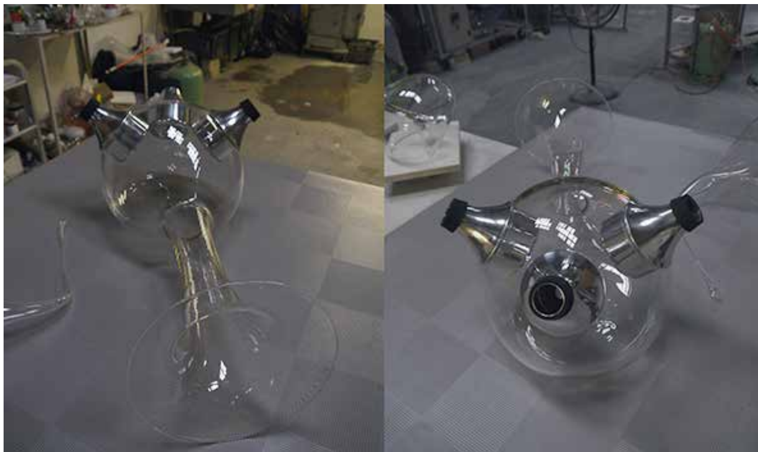
Big Harmon / 2016