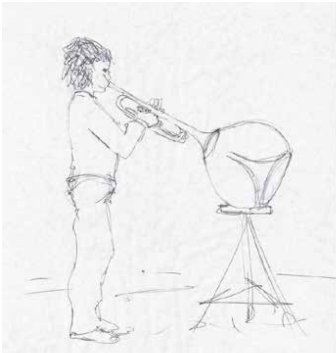
Croquis d'un dispositif pour trompettes / 2016